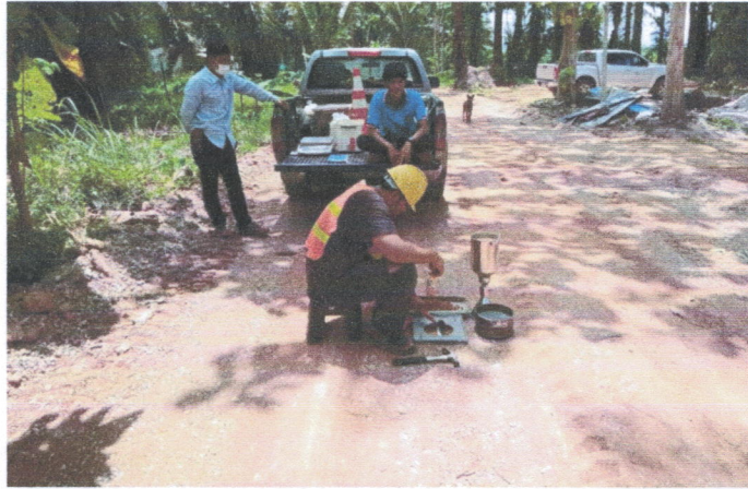
ภาพถ่ายระหว่างดำเนินการ