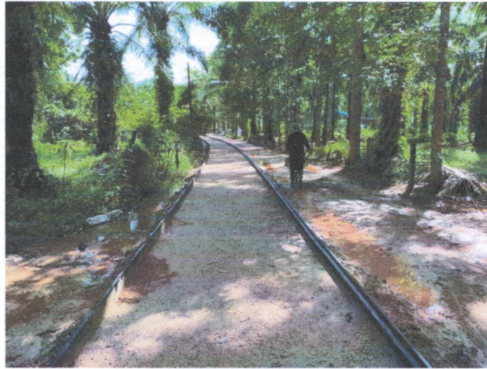
ภาพถ่ายระหว่างดำเนินการ